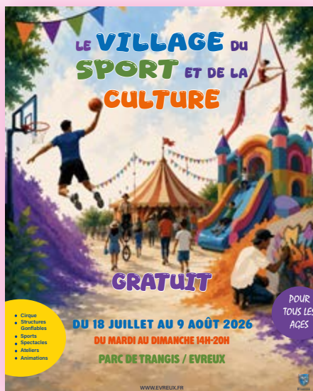
Village du sport et de la culture Du 18 juillet au 9 août