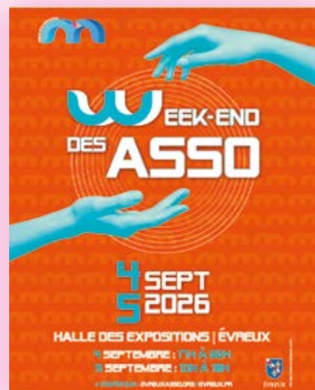
Week-end des Asso 4 et 5 septembre