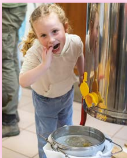
Animation 8 juillet