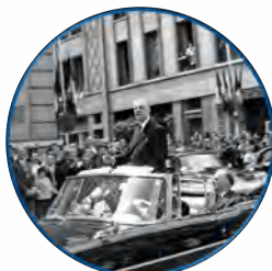
De Gaulle à Evreux, le 9 juillet 1960

↻ Entretenir la mémoire de la Libération ↻