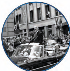
De Gaulle à Evreux, le 9 juillet 1960

↻ Entretenir la mémoire de la Libération ↻